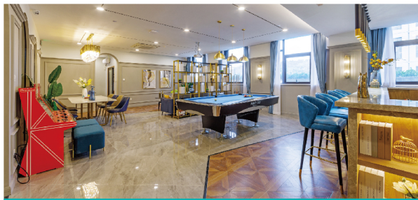
高颜值空间 让观感舒心