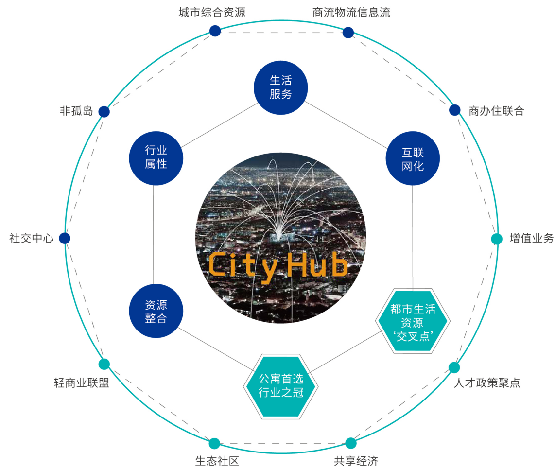
City Hub 城市资源聚落

龙湖冠寓肩负社会责任，积极配合各地人才引进安居政策，协助政府解决人才安居问题。截止目前，已与全国多个重点城市政府及相关事业单位合作落地40多个项目，提供超过2万套人才住房，助力提升各个城市人才吸引力。