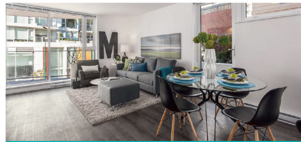
高标准质控 让用户安心