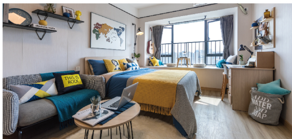
人性化考量 让生活暖心