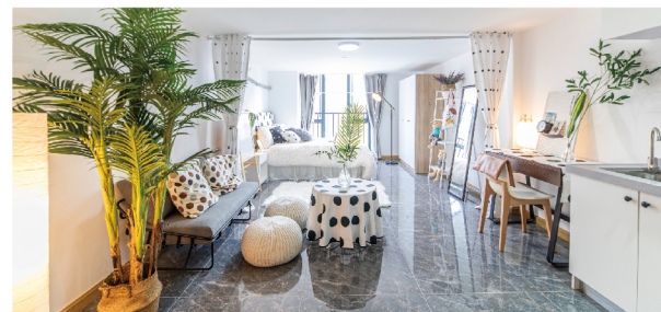
多样化户型 让居住随心